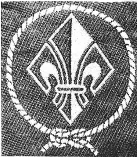
Bund der Pfadfinder

Sieht man heute den Bund mit all seinen Aktivitäten, läßt sich zum Teil kaum noch ermesen, unter welchen Schwierigkeiten er sich aus zwei Bünden zusammenfügte - und diese Entwicklung hat letztendlich gezeigt, daß der Entschluß zur Fusion richtig war!